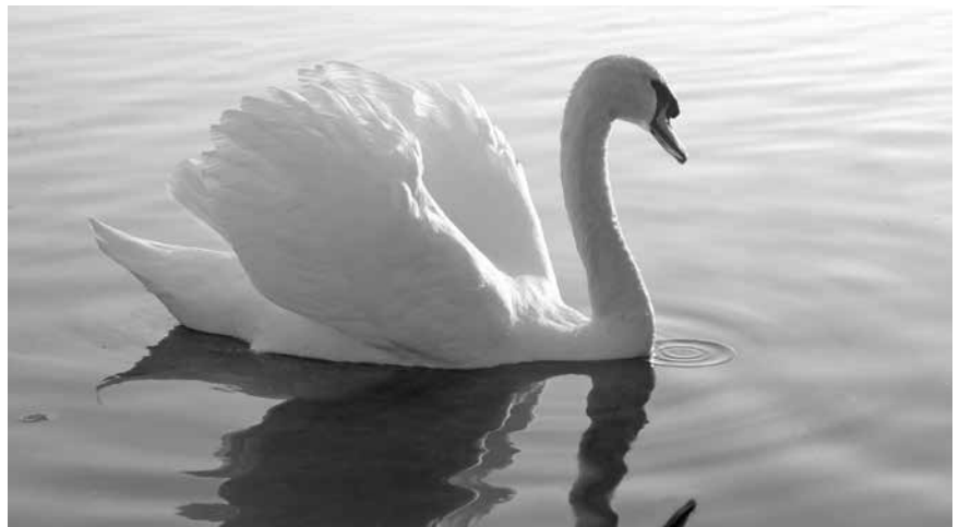
... hatte aber noch nie einen Schwan gefangen.