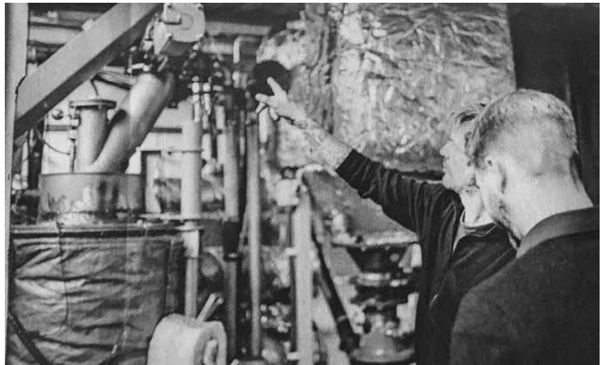
Immer im Blick, immer gut gewartet: Die Anlagen regulieren sich weitgehend selbst.

So können bei Schwankungen der Brennstoffqualität schnelle Anpassungen der Betriebsparameter vorgenommen werden. Der Aerobe Thermo-Tockner (ATT) von Mutec reichert den