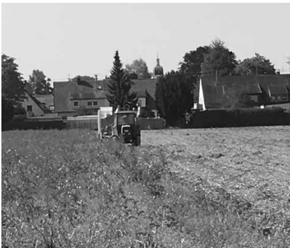
Kartoffelernte in der Flur zwischen Hammerschmiede und Firnhaberau.