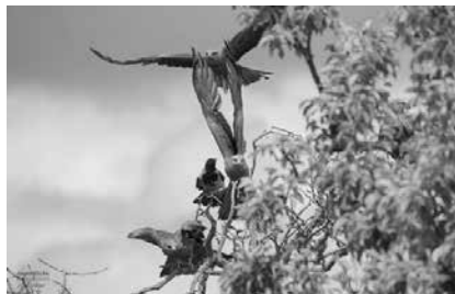
Großvögel wie Milanpärchen überwachen das Treiben.