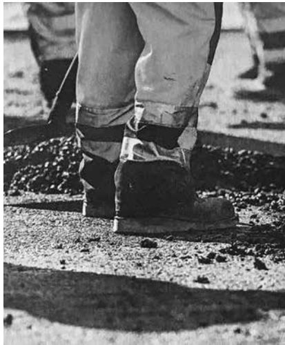
Das Baugewerbe hofft auf Aufträge durch die öffentliche Hand, etwa im Straßenbau

über die Länder einen Betrag in Höhe von 50% der auf der Grundlage der Mai-Steuerschätzung zu erwartenden Gewerbesteuermindereinnahmen.